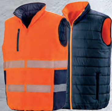
FLUORESCENT ORANGE (811)