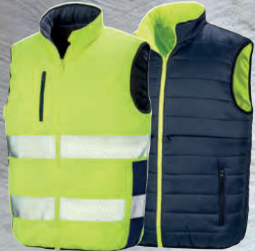
FLUORESCENT YELLOW (394)